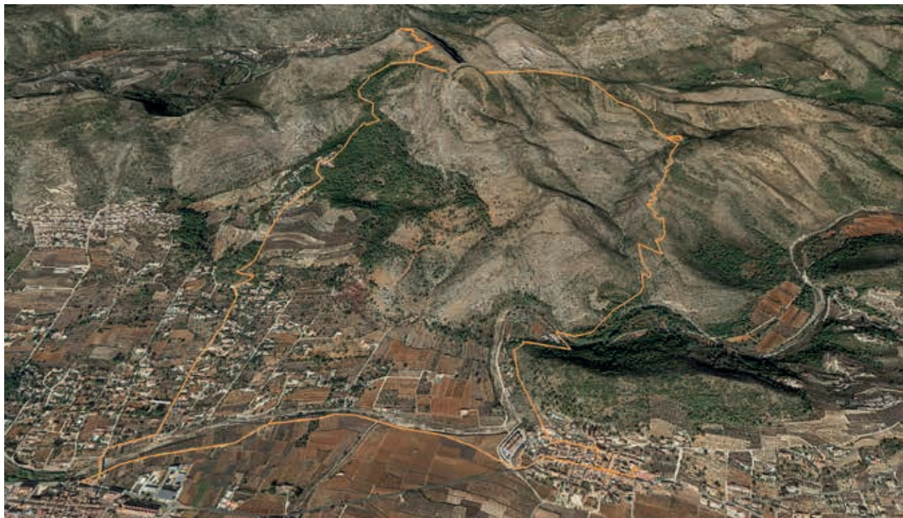
IMAGEN DE LA RUTA

VA A través del sender PR CV-53.5, ruta des de Llíber a la Font d'Aixa, amb pas per Xaló, per acabar al municipi de Llíber.